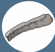
Bracciale a 6 camere