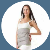
Cintura addominale a 6 camere