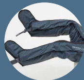
Gambali XL 6 camere