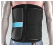
BACK WRAP (FASCIA TERMICA PER LA SCHIENA)