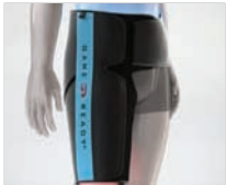
HIP/GROIN WRAP (FASCIA TERMICA PER ANCA/INGUINE)