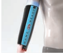
ELBOW WRAP - STRAIGHT (FASCIA TERMICA PER GOMITO DIRITTO)