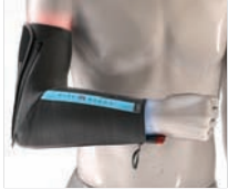
ELBOW WRAP - FLEXED (FASCIA TERMICA PER GOMITO FLESSO)