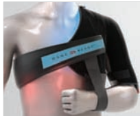
SHOULDER WRAP (FASCIA TERMICA PER LA SPALLA)

PER L'USO ESCLUSIVO CON IL SISTEMA GRPRO 2.1