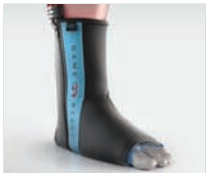
ANKLE WRAP (FASCIA TERMICA PER CAVIGLIA)

PER L'USO CON I SISTEMI MED4 ELITE E GRPRO 2.1