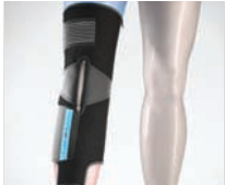
KNEE WRAP - ARTICULATED (FASCIA TERMICA PER GINOCCHIO ARTICOLATO)