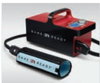
UNITÀ DI CONTROLLO GRPRO 2.1

PER L'USO ESCLUSIVO CON IL SISTEMA GRPRO 2.1