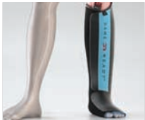
HALF-LEG BOOT WRAP (FASCIA TERMICA PER STIVALE A MEZZA GAMBA)