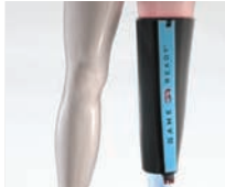
KNEE WRAP - STRAIGHT (FASCIA TERMICA PER GINOCCHIO DIRITTO)